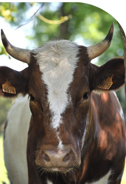
L'étoile de la Ferrandaise barrée

Une mission accomplie et un travail collectif auréolé du Prix de l'Agrobiodiversité, attribué par la Fondation du Patrimoine et les laboratoires CEVA, en 2024.