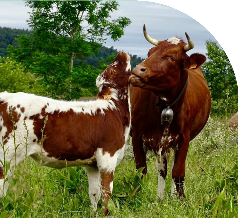
Moment de tendresse entre mère et fille

Si, au début du XX e siècle, la race Ferrandaise dominait les pâturages puydômois avec plus de 140 000 vaches à son apogée, la spécialisation et la mécanisation de l'agriculture dans les années 1960 auraient pu lui être fatales. Ses meilleurs atouts se retournent contre elle : la mixité de sa race qui permet de produire à la fois lait et viande, ainsi que ses capacités d'attelage. Frôlant l'extinction avec moins de 200 femelles recensées à la fin des années 70, une poignée d'éleveurs passionnés refuse pourtant de la voir disparaître . Soutenu notamment par l'Institut de l'Élevage, un plan de sauvegarde rigoureux permet à la Ferrandaise de reconquérir peu à peu ses terres natales.