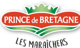
Chloé LE CORRE Chargée de communication de CERAFEL - Prince de Bretagne -

« Un nouveau hall, un nouveau stand, une nouvelle organisation, mais un public toujours aussi intéressant et intéressé. La maison des vétérinaires et la Ferme pédagogique, des moments forts du SIA toujours autant plébiscités par les visiteurs. »