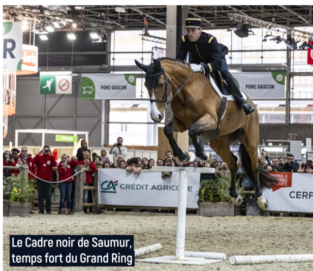
Le Cadre noir de Saumur, temps fort du Grand Ring