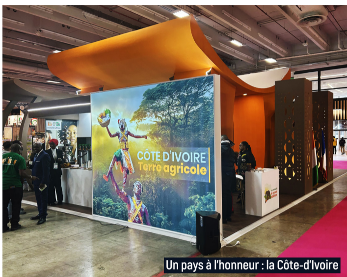
Un pays à l'honneur : la Côte-d'Ivoire